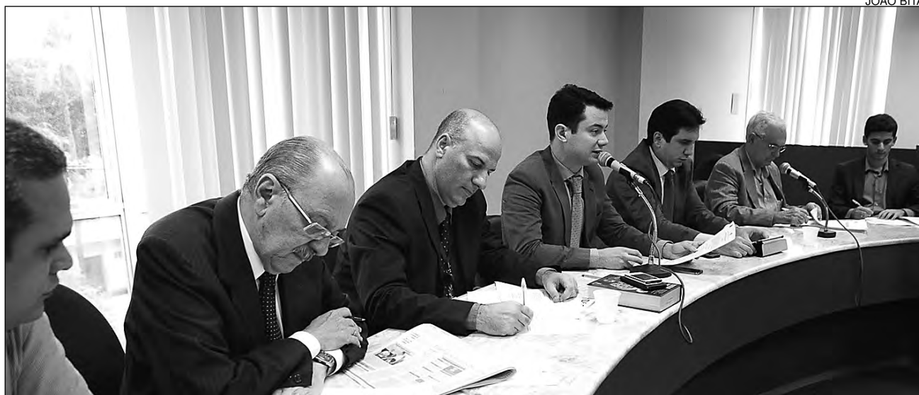
BALANÇO - Durante o primeiro semestre, a Comissão de Finanças analisou 135 matérias e aprovou 98 projetos

volvimento Municipal (FEM), no valor de R$ 155 milhões. Os recursos são destinados ao reforço das dotações orçamentárias relacionadas a planos de trabalho muni-