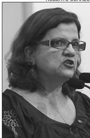
TERESA - R$ 12 milhões

pontuou. A verba também será usada na aquisição de computadores, de veículos e de móveis novos, além de aumentar o acervo da biblioteca.