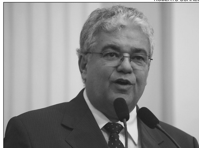
BALANÇO - Moraes citou encerramento das atividades