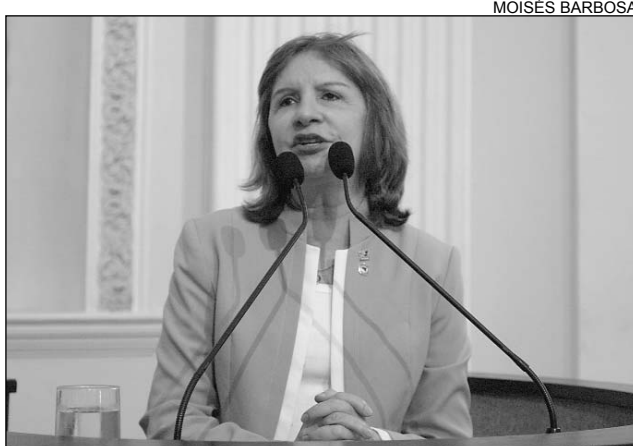
NATUREZA - Postura ética da ex-ministra é reconhecida