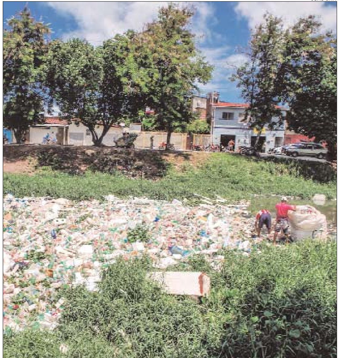
Despejo de lixo em rios e canais é fator agravante. População e poder público têm responsabilidade