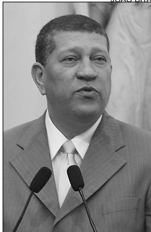
RUFINO, PIMENTEL E NASCIMENTO - Todos enaltecem posicionamento da CBF