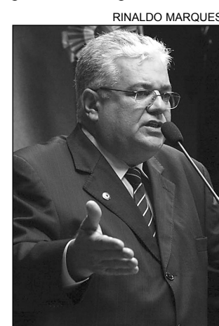
AUDIÊNCIA - Moraes

O tucano fez um apelo para que seja realizada uma audiência pública com o intuito de solucionar o problema. "Um dos impasses é saber de quem é a responsabilidade pela manuten-