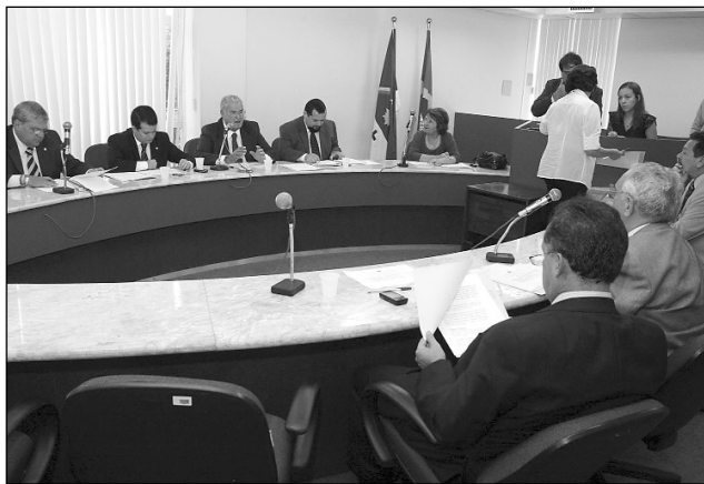
FINANÇAS E ADMINISTRAÇÃO - Deputados ressaltaram que Poder Executivo realizará compensação do ecossistema

A apreciação da matéria atende a determinações da Lei de Política Florestal de Pernambuco. A norma somente autoriza a retirada em caso de propostas de utilidade pública ou interesse social. De acordo com o Governo do Estado, a medida diz respeito a empreendimento de infraestrutura hídrica, essencial à inserção regional. Ainda assim, trabalhos de compensação do ecossistema deverão ser realizados.