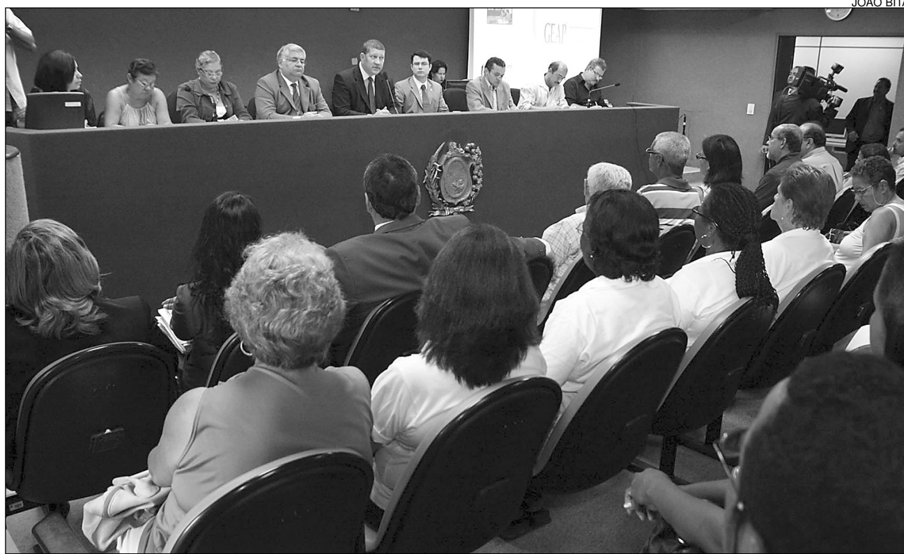
NACIONAL - Problema também será tratado na Câmara Federal. Em Pernambuco, são 43 mil pessoas prejudicadas

Para o petista, a medida provocou apreensão. Usuários temem perder o benefício por não poderem continuar pagando. “Atualmente, a Geap contabiliza, em Pernambuco, 43 mil pessoas vinculadas ao plano. Todas cobram a redução do percentual e ameaçam