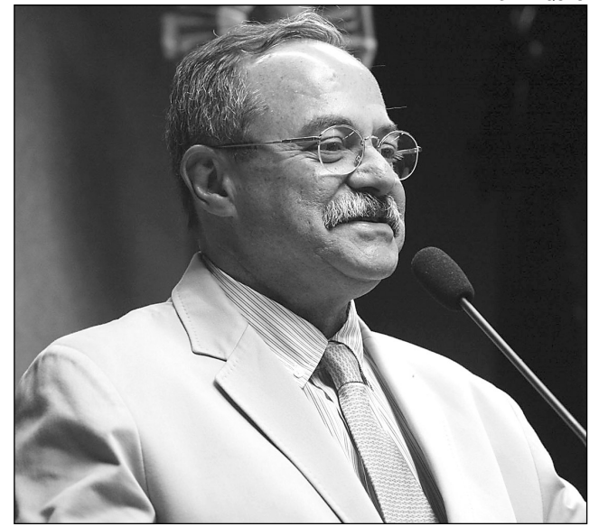
EURICO - Importância da localidade para Pernambuco

Localizada a 215 quilômetros do Recife, Pesqueira tem como base econômica o turismo, a produção artesanal e industrial de renda re-nascença, a pecuária