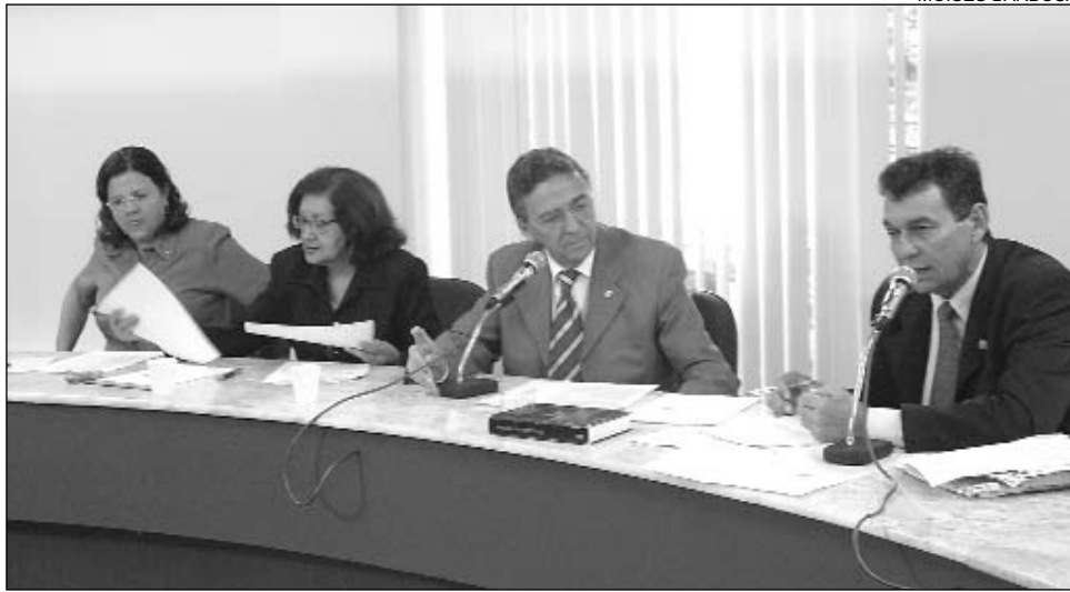
ORÇAMENTO - Abertura de crédito, no valor de R$ 6 milhões, também foi acatada

As sinalizações táteis deverão ser feitas por meio de figuras ou caracteres em relevo e braille, e a sonora, com recursos auditivos, como ruídos para alertar o ouvinte. Estão previstos também recursos vibratórios para alertar os deficientes visuais e auditivos, além das sinalizações por textos e