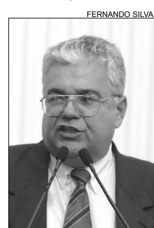
PSDB - Candidato oficial

em 1976. A votação "expressiva" para a Câmara Federal, como representante de São Paulo, e a "grande atuação" na Assembleia Constituinte também foram destacadas. "Em 1994, Alckmin foi