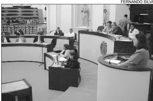
PRAZO - Deputada lamentou pouco tempo para o debate