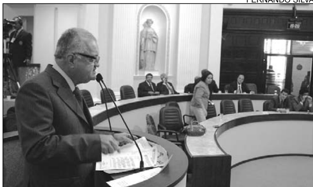
UCHÔA - Denúncias ao TCE e ao Ministério Público

"Contrariando a Constituição, o gestor enviou à Câmara Municipal projeto de lei solicitando autorização para efetivar o pagamento do salário mínimo aos funcionários. Em seguida, vetou a matéria e estabeleceu vencimentos no valor de R$ 260,00", enfatizou, acrescentando que a auditoria deve averiguar o