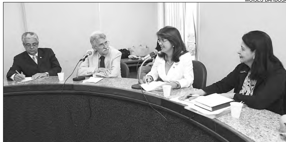
TAREFA - Ideia é convidar secretária estadual para tratar políticas para segmento feminino