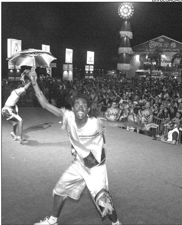
CONTAGIANTE -Passistas esbanjam flexibilidade

Ritmo quente e pernambucano comemora centenário