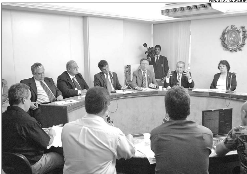
SISMEPE - Oficiais e praças da PM não chegaram a um acordo sobre plano de saúde

O colegiado apreciou mais sete propostas e retirou da pauta de votação outras sete, uma delas por solicitação do deputado Adelmo Duarte (PFL) e as demais pela ausência de pareceres da Comissão de Justiça. Entre as