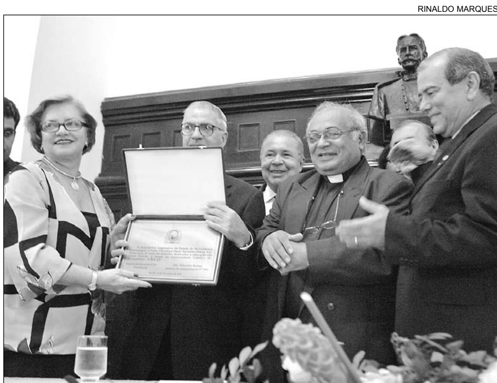
INICIATIVA - Presidente Romário (d) e Rufino propuseram a reunião solene

Recife, quinta-feira, 15 de dezembro de 2005