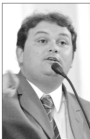
ALFE ANA - Integram Desenvolvimento Econômico

Na última reunião ordinária do colegiado este ano, o presidente da Co-