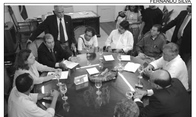
PROCAP - Uma das principais solicitações da categoria

Atualmente, em todo o Estado, existem apenas 28 leitos para doenças cardiológicas. Lins espera que o Governo envie, em caráter de urgência, um projeto de lei à Assembléia com o objetivo de abrir concurso público para preencher 1.421 vagas para médicos, enfermeiros e pessoal de apoio. O