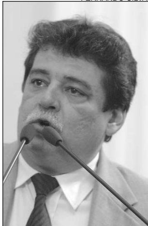
EDUCAÇÃO - Precária

versidade Federal de Pernambuco (UFPE). "Milhares de alunos vão terminar o ano sem aulas de química e física e os professores estão sem perspectiva de melhoria salarial", enfatizou, registrando, ainda, a falta de uma política de habitação, de fomento ao emprego e de ajuste fiscal.