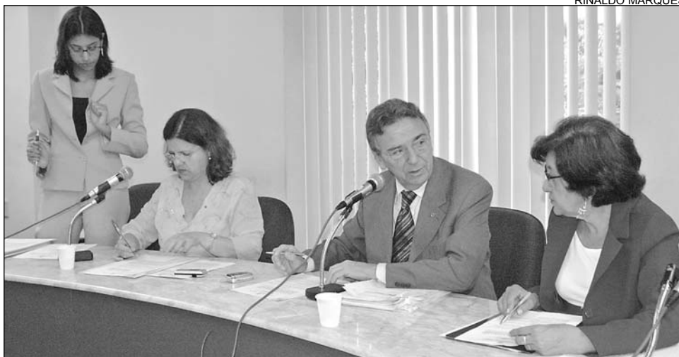
BALANÇO - Um total de 213 matérias tramitaram no colegiado este ano