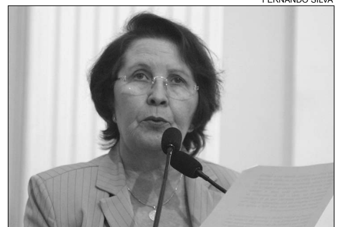
BENEFÍCIO - 12 mil pessoas, entre alunos e moradores