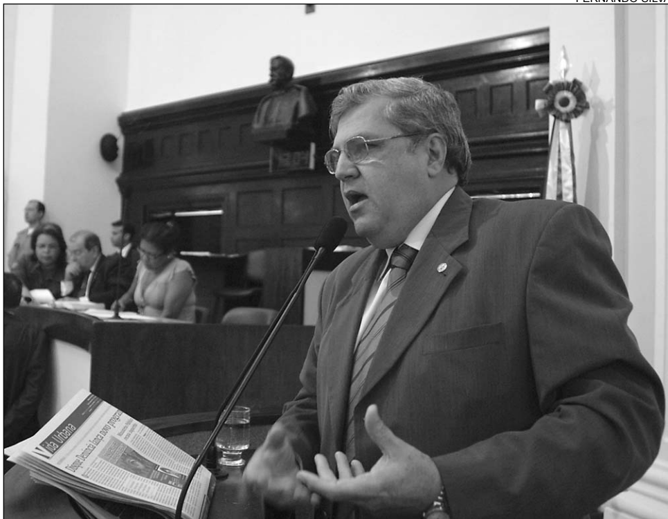
INSTITUIÇÃO - Progressista citou aparelhagem e reciclagem dos policiais militares