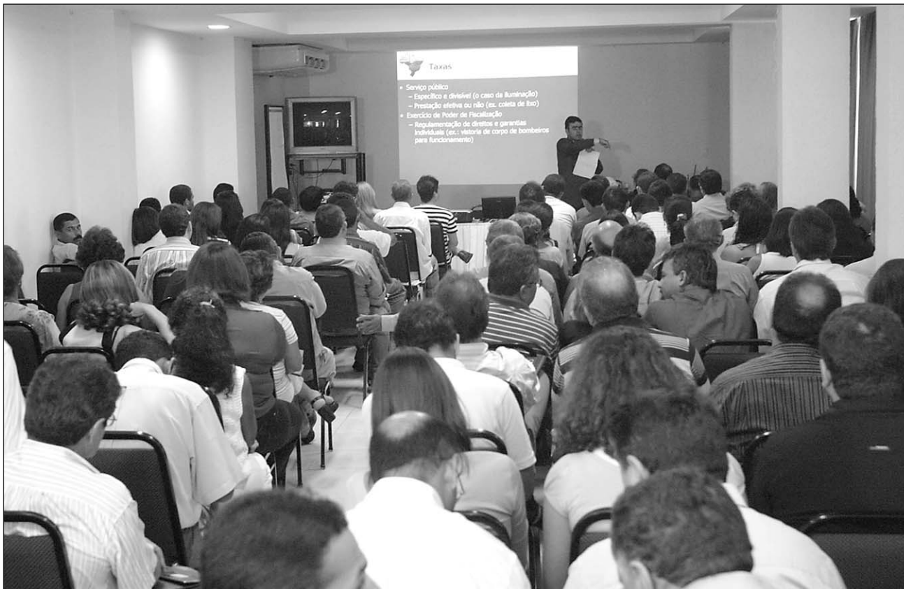
CASA CHEIA - Escola promoveu no dia 12 de maio deste ano evento para abordar o Poder Legislativo Municipal

Saber o que pensam e o que desejam os municípios pernambucanos. Esse é o tema que será debatido hoje, a partir das 9h, no auditório da Escola do Legislativo de Pernambuco (Elepe). O assunto, ministrado pelo coordenador do Instituto Cidades, Maximiliano Carneiro da Cunha, será abordado em três momentos: hoje, com a Oficina de Avaliação dos Instrumentos e Pesquisa , e em dois seminários, no dia 29 de agosto e 5 de setembro.