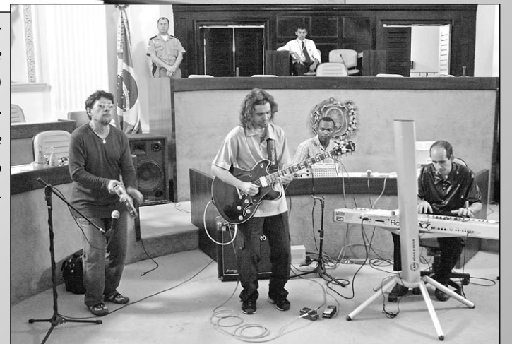
DIVERSIDADE - Noise e Viola (3) e Trio Sotaque (4) estiveram no Plenário nos meses de março e dezembro de 2005, respectivamente