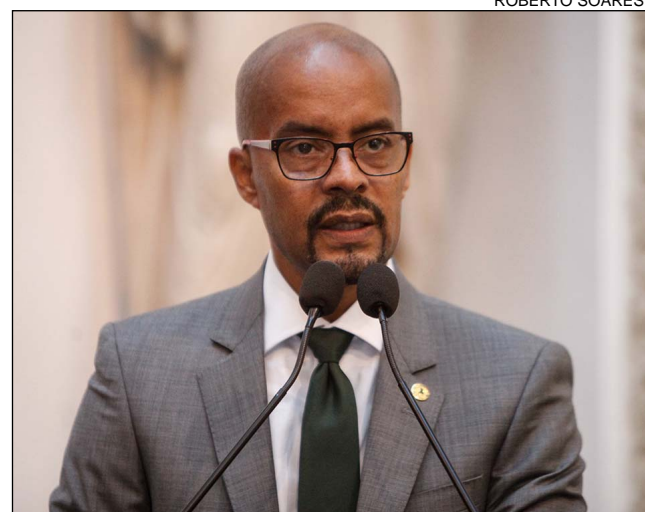
EPISÓDIOS - Massacre de Orlando e assassinato de idosa

ENTENDA OS CASOS - No último domingo (12), 49