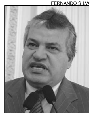
DIVERGÊNCIA - Apoio a Humberto e a Mendonça Filho