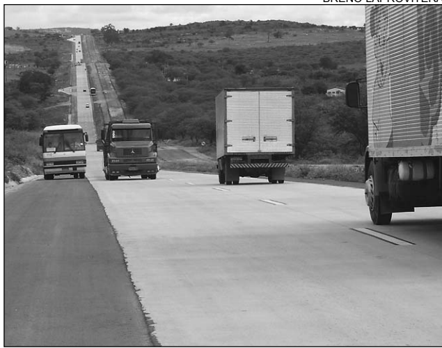
CONCRETO - Mais de 300 placas serão substituídas

O pedetista declarou que mais de 300 placas de concreto foram substituídas e culpou as empreiteiras responsáveis pela construção. "É um absurdo ver que uma estrada nova, que deveria suportar um tráfego intenso por 20 anos, esteja precisando de reparos. O Executivo não pode pagar essa conta, que é de responsabilidade das empreiteiras", criticou.