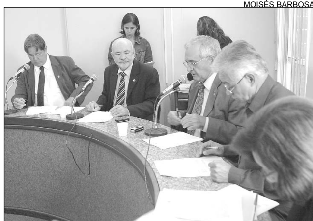
ADMINISTRAÇÃO - Debate sobre cargos na Saúde

As despesas com a criação de 158 novos cargos comissionados e funções gra-