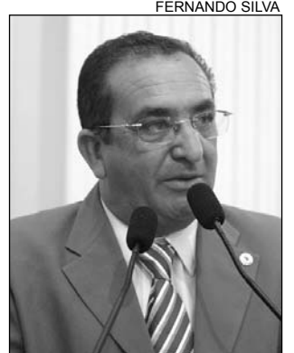
ÁGUA - Prioridade

Bringel também salientou que o Araripe tem a maior reserva de gipsita do País, fornecendo 75% do gesso consumido no Brasil. "Apesar disso, é preciso destacar que não basta vocação natural. É necessária a estrutura básica. No Araripe, a questão da água é