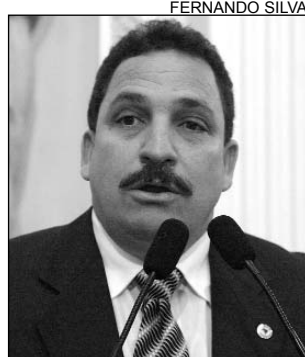
CARREIRA - Vários cargos