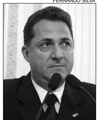
BARRETO - Gás natural

O deputado reivindicou a ramificação da distribuição de gás natural. "A obra está em operação e passa a qua-