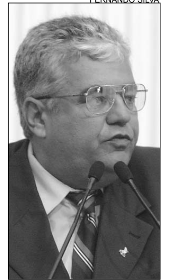
MORAES - Denúncia