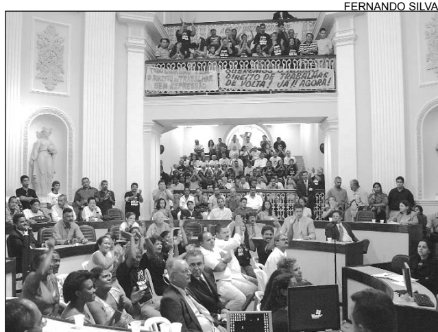
PALÁCIO - Presença maciça de vários segmentos

A audiência foi promovida pelas Comissões de Constituição, Legislação e Justiça (CCLJ) e de Defesa da Cidadania da Casa. A intenção dos parlamentares é realizar, ainda, reuniões em Olinda, para debater com a população, vereadores e prefeitos das cidades da Região Metropolitana Norte; e em Jaboatão, atendendo ao Recife e a municípios da Região Metropolitana Sul. Segundo o presidente da