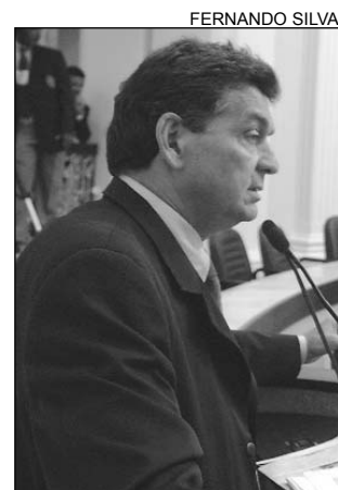
REFORMA - Urgência

O parlamentar ainda considerou legítima a ocupação das terras de usinas canavieiras. "Além de não gerar alimento para o povo, está provado que a cana-de-açúcar é um dos maiores responsáveis pela opressão e escravidão do trabalhador rural. As usinas são as que mais devem ao Instituto de Seguridade Social (INSS), totalizando mais de R$ 560 milhões em débitos."