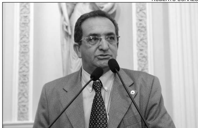
BRINGEL - Recurso hídrico não chega à zona rural

A Adutora do Oeste, que utiliza o Rio São Francisco, foi uma iniciativa do Governo Federal repassada ao Exe-