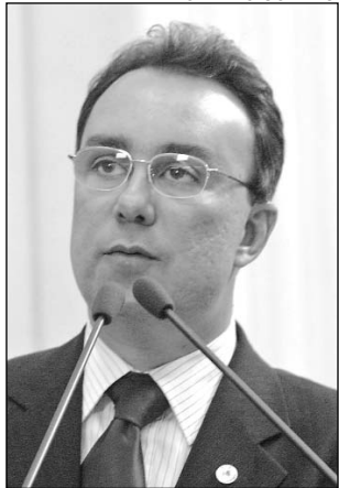
TEOBALDO - Participou