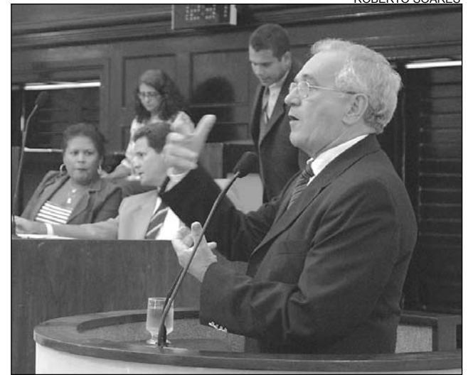
MAVIAEL - Para deputado, jovem infrator deve ser punido