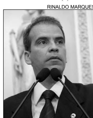
FEITOSA - Registro

sou. A eleição foi realizada na última sexta-feira (9).