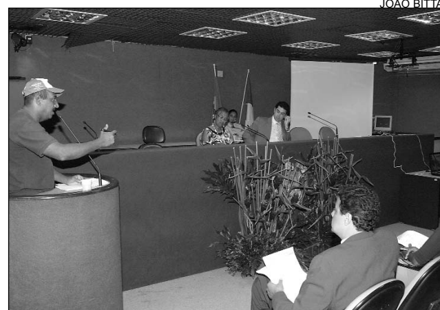
ARGUMENTO - Produto pode ser reciclado inúmeras vezes

Segundo Pimentel, o quilo do alumínio rende, em média, R$ 3,20, enquanto o do aço rende apenas R$ 0,20. "Há, ainda, a questão de energia. O processo de reciclagem do alumínio gasta 95% menos energia, se com-