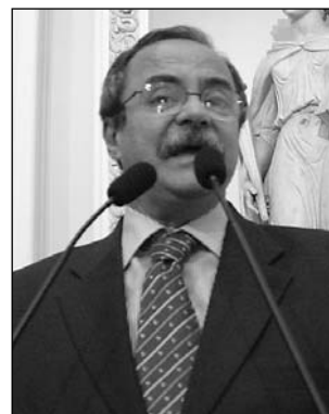
EURICO E ISALTINO - Soluções diferentes para o conflito

Isaltino Nascimento destacou que os problemas não acontecem apenas no Aníbal Bruno. "O Aníbal é a maior unidade prisional pública do Brasil, mas temos conflitos em todas as unidades do Estado, e o governo vem agindo", observou, afirmando que a comissão parlamentar proposta por Eurico para ir a Minas Gerais em busca de informações sobre a privatização dos presídios, local onde a medida está dan-