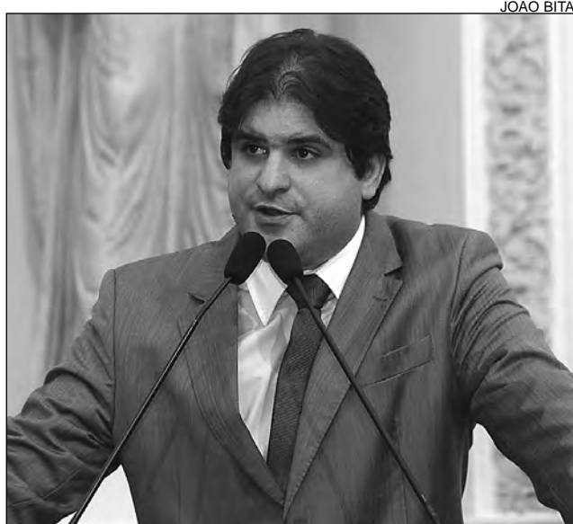
DETALHES - Labanca convidou demais parlamentares

O socialista ainda lembrou a criação do Comitê Pernambuco Copa do Mundo, pelo Poder Executivo, com o objetivo de planejar e acompanhar as iniciativas necessárias à competição. Participam várias secretarias de Governo, além dos Poderes Legislativo e Judiciário. A Alepe é represen-