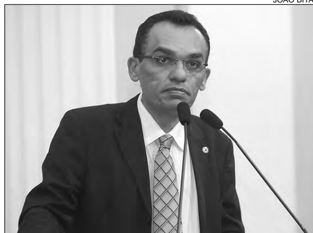
AMORIM - Terrenos ociosos do Governo devem abrigar bichos

"A melhor alternativa para sanar o problema é utilizar áreas ociosas pertencentes aos Governos Federal e Estadual para abrigar os animais", argumentou.