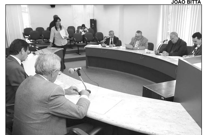
FINANÇAS - Proposta de lei foi distribuída no encontro

Ainda durante a reunião, outras três proposições foram distribuídas e três, aprovadas por unanimidade. Uma das propostas acatadas foi o Projeto de Lei nº 644/08, também do Executivo, prevendo a abertura de crédito suplementar no valor de R$ 6 milhões, a fim de construir e recuperar casas danificadas por inundações.