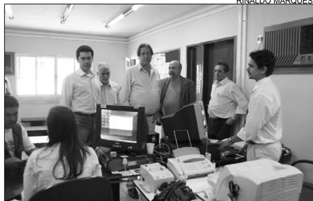
IN LOCO - Posto da companhia não atende necessidades

mentos congelados que guardava", lamentou. Como se não bastasse, a aposentada recebeu uma multa do valor de R$ 4 mil, após a Celpe examinar o medidor de energia da sua residência. Ela recorreu à Justiça para não pagar a multa.