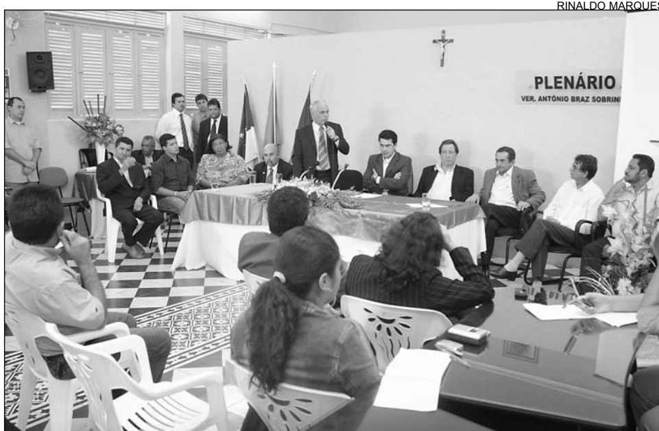
AUDIÊNCIA - Prejuízos financeiros no setor gesseiro comprometem economia local