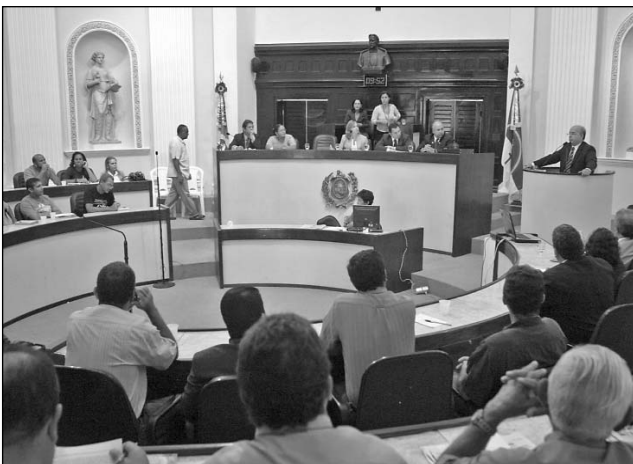
PLENÁRIO - Diversas audiências foram realizadas

O lançamento da campanha Se Liga Cidadão!, que tem como objetivo evitar o reajuste nas contas de energia elétrica no Estado, foi uma das principais ações da Comissão de Defesa da Cidadania da Alepe neste semestre. A iniciativa visa recolher assinaturas para o abaixo-assinado que será enviado ao Governo Federal, a fim de que os custos da Termocuiabá sejam transferidos para o sistema elétrico nacional, a exemplo