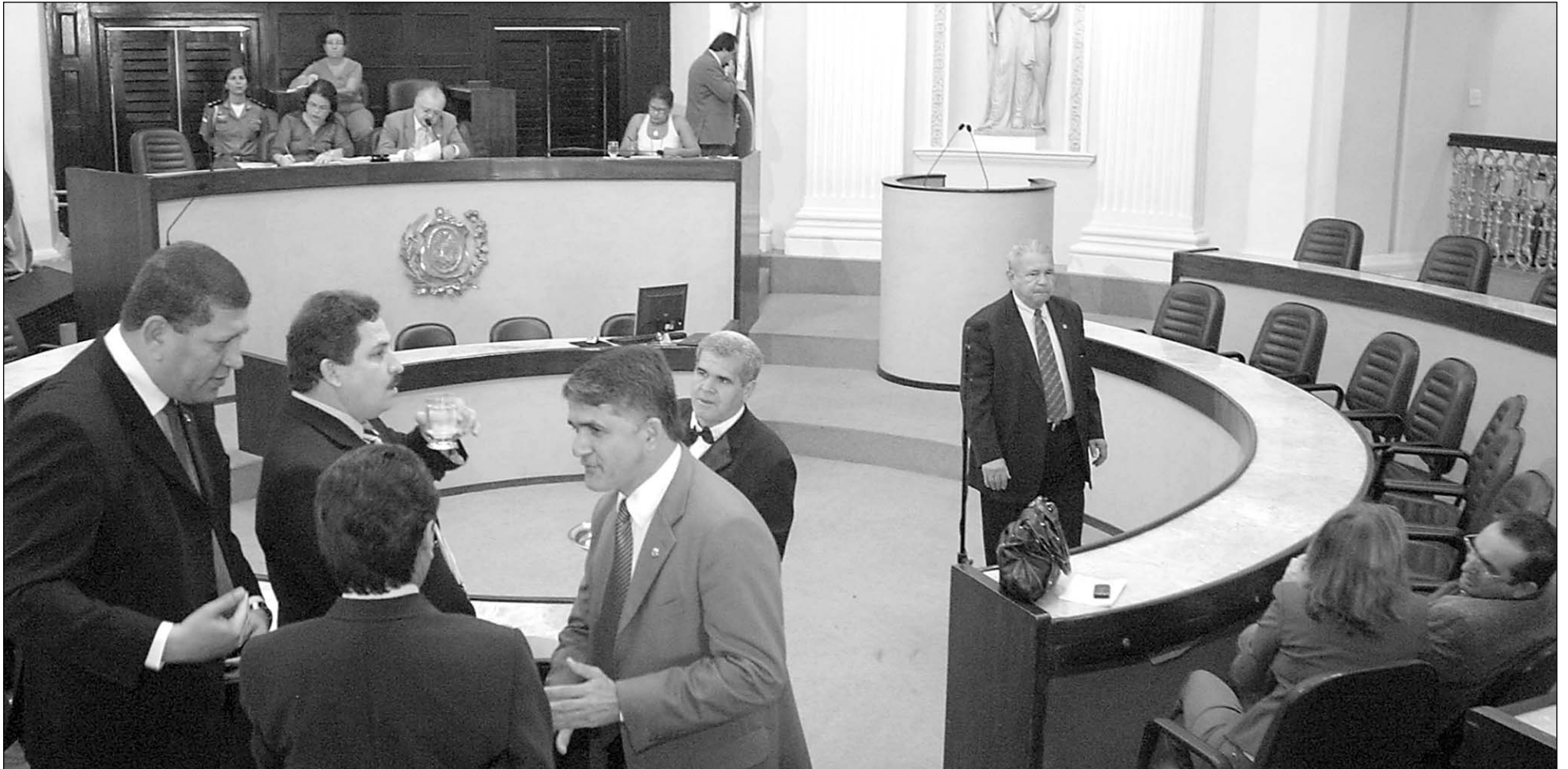
PLENÁRIO - Parlamentares se reuniram, ontem, extraordinariamente, para avaliar proposições de autoria do Poder Executivo. Matérias tramitaram em regime de urgência