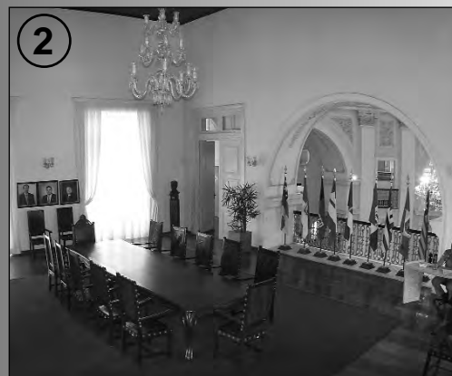
1 IMPONENTE - Fachada da sede do Parlamento e detalhes da construção centenária nas fotos 1, 2 e 3