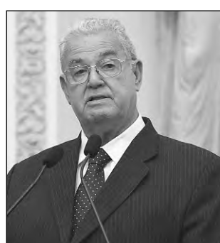
COELHO E ALVES - Elogios à atuação do Exército Brasileiro

Os deputados explicaram que entre Igarassu e a Paraíba