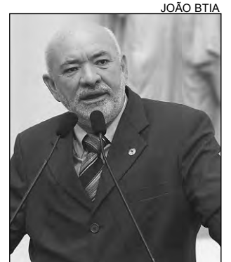
ABANDONO - Santos

Segundo o republicano, moradores da área rural saem de casa, ainda de madrugada, em busca de atendimento médico. Entretanto, por muitas vezes, não são atendidos. “O hospital fica cerca de quatro dias por semana sem mé-