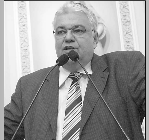
MORAES - Destaque para a história do município