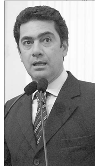
DECISÃO - Até 2009

nuará a mesma: elevada no campo pessoal e dura no campo ideológico. Isso também se aplica aos demais parlamentares", frisou, acrescentando que cabe agora às instâncias partidárias, considerando o regimento interno do partido, confirmar o desejo de Pimentel.