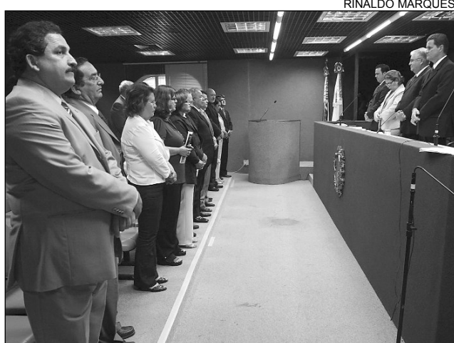
PESAR - Minuto de silêncio, antes da reunião plenária

O sepultamento aconteceu no domingo, no Ce-