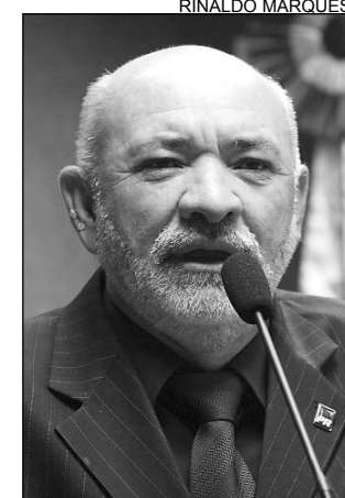
AGUA - Sem qualidade

De acordo com o republicano, o governador Eduardo