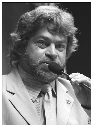
AMAURY E LEITE - Opiniões diferentes sobre temática

Em Paulista, por exemplo, a permissão de circulação dada ao transporte alternativo não é válida para as rodovias estaduais. “A PE 01, da Ponte do Janga até a Praia de Maria Fari-