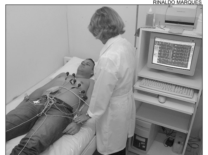
NÚMEROS - Mais de 20 mil atendimentos no ano passado