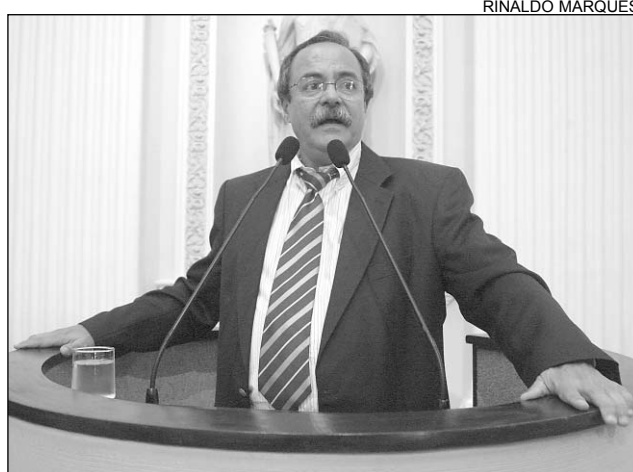
EURICO - Outras empresas poderiam realizar o trabalho

O que aconteceu no caso da Finatec foi que houve a escolha da empresa de consultoria de Brasília para fazer um contrato de prestação de serviços sem notória especialização, porque a fun-