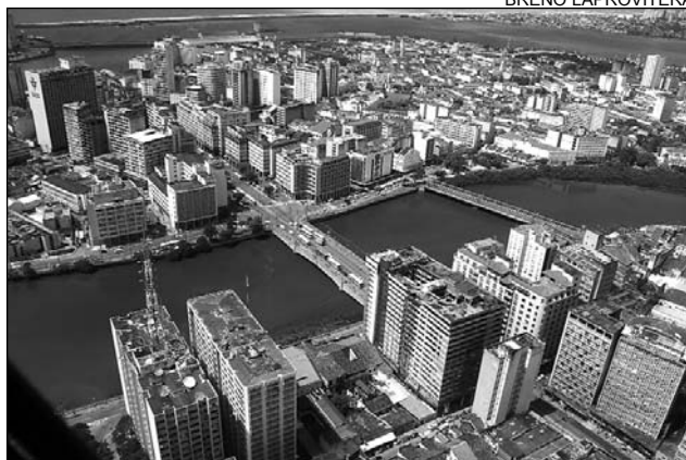
RECIFE - Veneza Brasileira chega aos 470 anos