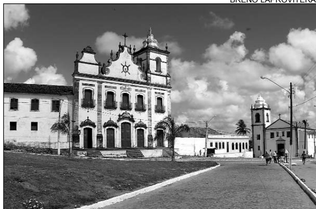
IGARASSU - Abriga igreja mais antiga do País (d)