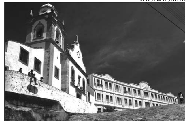
OLINDA - Patrimônio da Humanidade contabiliza 472 anos