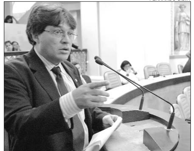
NA MÃO - Recursos estão com o Governo do Estado