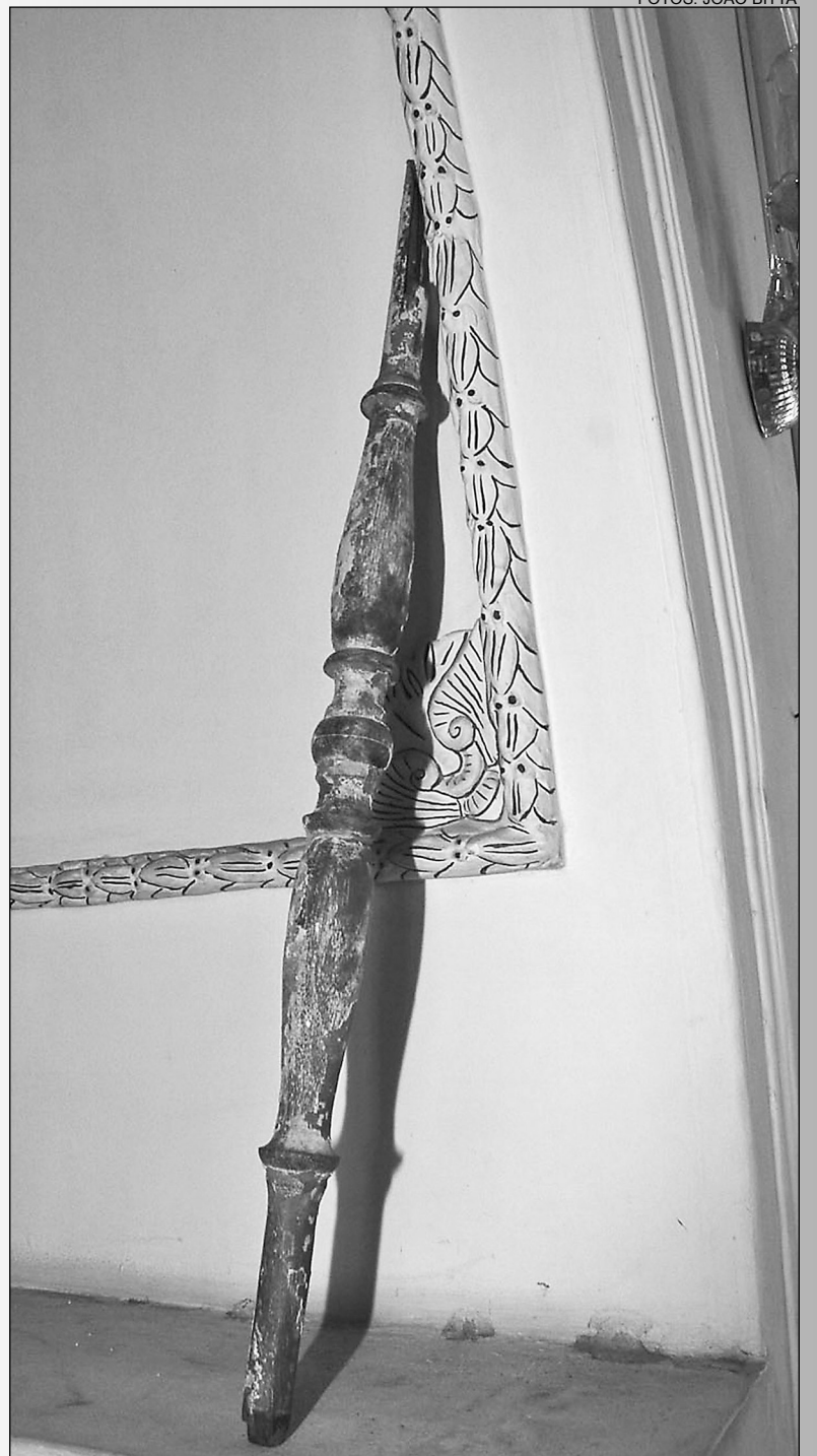
DETALHE - É de madeira do tipo ipê trabalhada e dava suporte a um lustre

HISTÓRIA - A pedra fundamental do Palácio Joaquim Nabuco, ou seja, o início formal da construção do prédio, data do ano de 1870. O edifício foi entregue em 1875, mas só foi concluído em 1876.