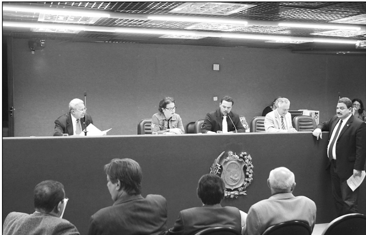
PAUTA - Três das proposições beneficiam servidores do Estado

O Plenário aprovou, ontem, em reunião extraordinária, 11 pareceres de redação final a projetos de lei ordinária e complementar, todos de autoria do Poder Executivo. Três deles criam Planos de Cargos, Carreiras e Vencimentos (PCVVs) para servidores de diversos órgãos da administração direta e indireta, além da Polícia Civil.