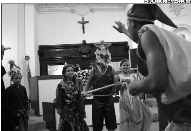
TALENTOS - O vendedor de sonhos foi a peça encenada

A noite de ontem na Assembléia Legislativa foi das crianças e adolescentes assistidos pelo Grupo Ruas e Praças. Eles foram a atração do Projeto Segunda Cultural deste mês e encantaram os presentes com a peça teatral O Vendedor de Sonhos . O espetáculo retratou o cotidiano dos jovens que moram na periferia da Região Metropolitana do Recife (RMR). "Queremos reinventar um olhar para o