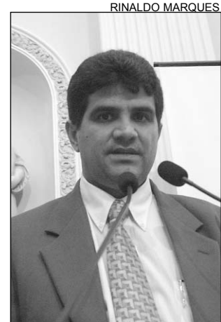
CLAUDIANO - Audiência

O governador Eduardo Campos (PSB) lembrou que o segmento estava esquecido e que, agora, a meta é desenvolvê-lo. "Levaremos mais estrutura ao Interior do Estado para que os agricultores tenham mais condições de trabalho e acesso a novas tecnologias", disse, acrescentando que Pernambuco adquiriu 600 mil doses contra a febre aftosa para serem aplicadas na segunda etapa da vacinação. "Ao todo, foram