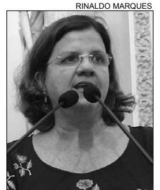
TERESA - Apoio à iniciativa

uma das 72 interditadas por risco de desabamento, no início deste ano. “Após a reforma, a escola passou a funcionar com mais vigor. Hoje, há também o projeto Viva o Verde, que planta árvores, flores e ervas”, lembrou.