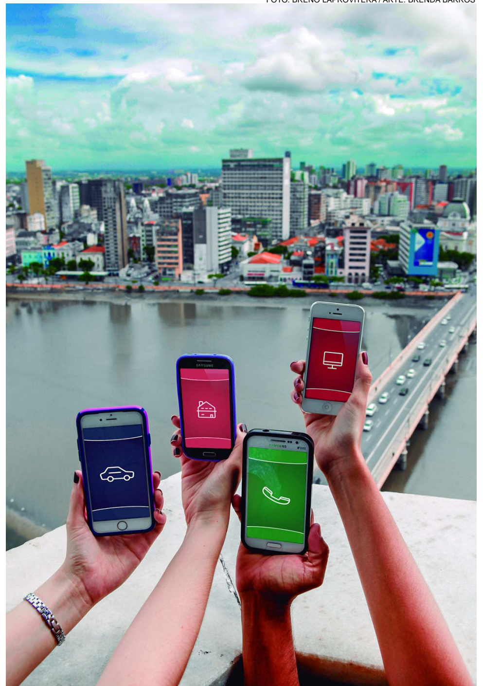
TECNOLOGIA - Novas formas de prestação de serviços via aplicativos impactam na economia local e exigem mediação do Poder Público

A opinião é compartilhada pelo deputado Beto Accioly. “Os taxistas têm uma série de regras a cumprir, as quais não cabem atualmente