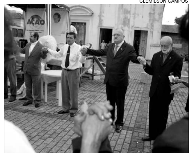
ORAÇÃO - Presidente da AL se uniu a lideranças religiosas

Milhares de comitês foram criados e estão espalhados pelo Brasil e Exterior, principalmente, na França, Suíça, Inglaterra, Canadá, Itália, Estados Unidos, Japão e Chile.