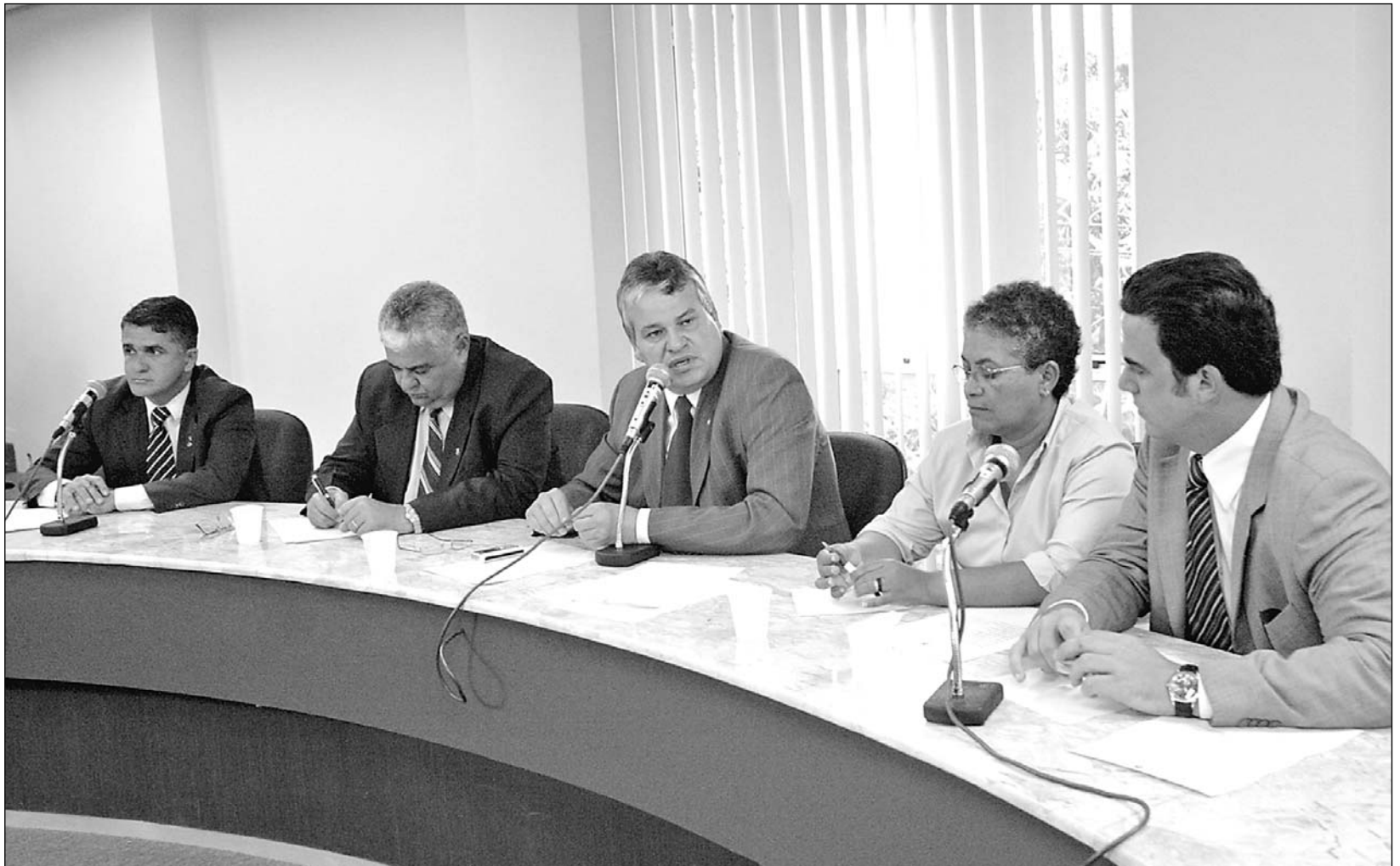
CHUVAS - Situação das famílias desabrigadas em 2005, devido às enchentes, também integrou a pauta de trabalho dos parlamentares na Alepe