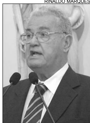
COELHO - Esforço

O Prêmio de Tecnologia a Serviço da Educação, criado pelo governador Eduardo Campos por meio do Decreto nº 30.890 de 15 de novembro de 2007, foi exaltado, ontem, pelo deputado Geraldo Coelho (PTB). A premiação envolve as escolas da rede pública de ensino do Estado e aborda temas como sexualidade, conhecimento, liberdade, segurança e responsabilidade quanto ao uso do corpo. O objetivo da iniciativa é promover ações que possibilitem ao jovem uma reflexão aguçada, a fim de construir uma relação de valorização.