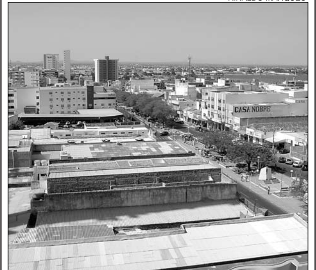
SÃO FRANCISCO - Cidades da região são prejudicadas