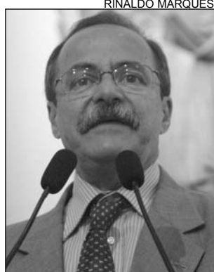
EURICO - Cobranças

A Prefeitura do Recife foi criticada, ontem, pelo deputado Pedro Eurico (PSDB). De acordo com o parlamentar, o prefeito João Paulo (PT) abandonou a cidade. "O centro é um exemplo do descaso e de degradação", disse. Para o tucano, a falta de manutenção nos equipamentos urbanos deixa a Capital deplorável. "A cidade exala mal-cheiro por todos os cantos", frisou, acrescentando que o gestor só se preocupa em promover festas, esquecendo-