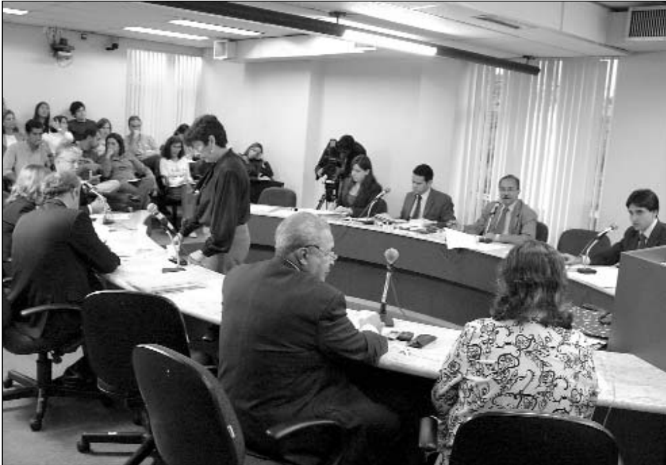
JUSTIÇA - Matéria do Executivo foi aprovada na CCLJ e, em 1ª discussão, no Plenário