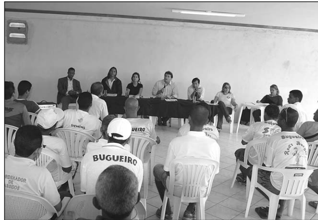
CATEGORIA - Objetivo é regulamentar o serviço

dos buggies". Sobre a colocação das placas vermelhas, ela ressaltou que o Detran estabelece a concessão de uma placa para cada mil habitantes. Nesse caso, os buggies de Ipojuca só teriam direito a 60 placas.