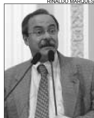
EURICO - Questionamento

Eurico disse que 40 pessoas, entre políticos e empresários, foram indiciadas por formação de quadrilha, lavagem de dinheiro, evasão de divisas, corrupção ativa e passiva e peculato. "Foram mais de 57 delitos", frisou, acrescentando que no texto do MPF, com 136 páginas, o ex-ministro da Casa Civil José Dirceu aparece como chefe da organização e o ex-presidente do PT José Genuino, o ex-tesoureiro Delúbio Soares e o ex-secretário Sílvio