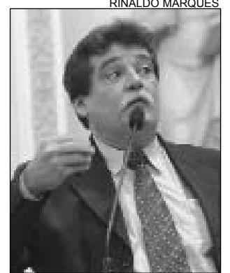
COSTA - Defesa de Lula