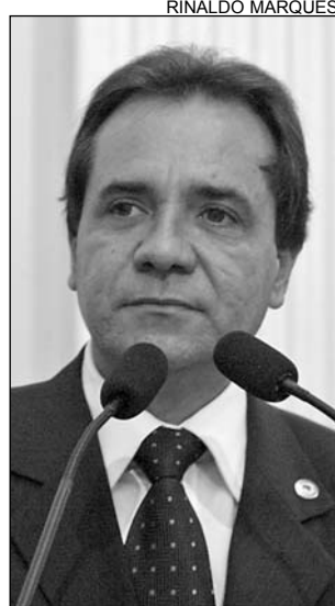
ECOLOGIA - Desrespeito

De acordo com o tucano, foram derrubadas 45 árvores nas Ruas da Brasília e José Bernardino e