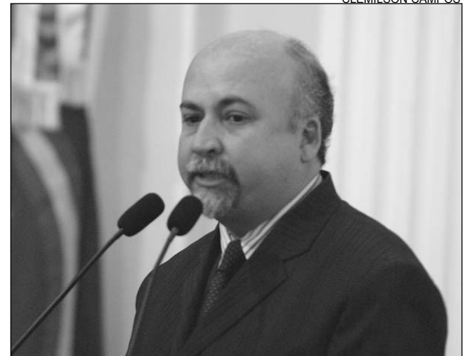
JUVENTUDE - Políticas públicas direcionadas aos jovens