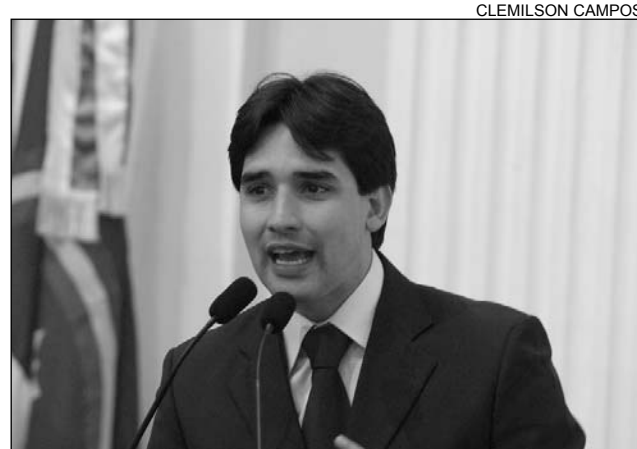
POSTURA - Elogios ao governador Eduardo Campos