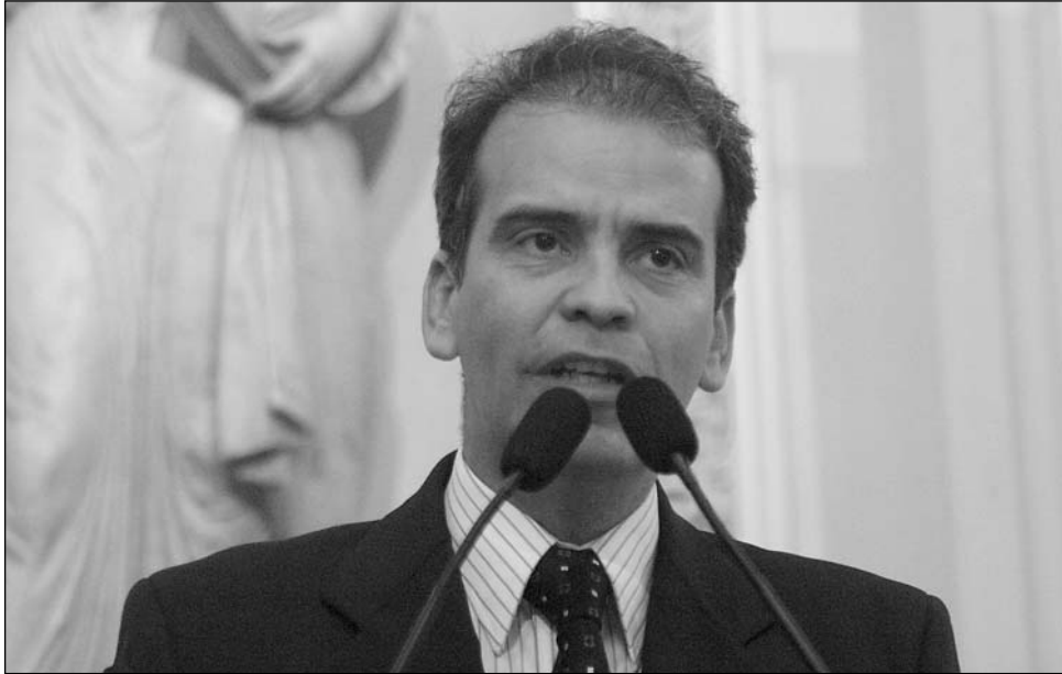
EXPURGO - Para republicano, maus policiais devem ser banidos da corporação