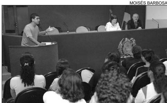
MOISÉS BARBOSA INCENTIVO - Estudantes e educadores aprovaram iniciativa

De acordo com a deputada Teresa Leitão (PT), "As cenas retratam a realidade das escolas. Não há atores nem atrizes, é o pró-