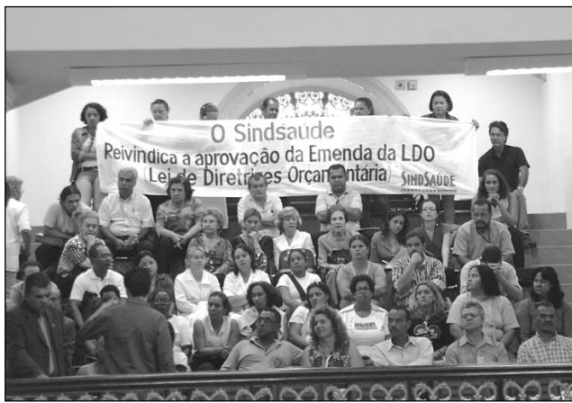
COBRANÇA - Servidores querem aprovação de emendas

Segundo o presidente da Casa, a matéria deverá receber o parecer final da Comissão de Finanças, Orçamento e Tributação até o próximo dia 13. O texto será encaminhado para votação em Plenário no dia 14 e o resultado, publicado no Diário Oficial do Poder Legislativo no dia