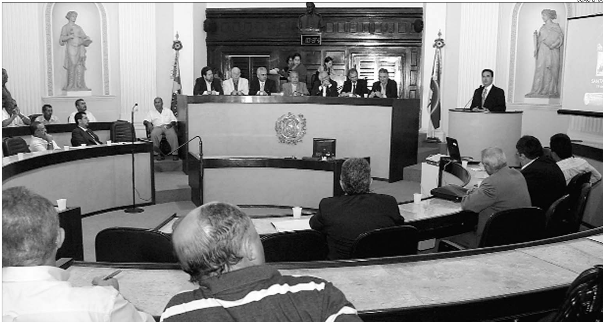
ACÚCAR E ÁLCOOL - Reativação da Usina Santa Terezinha, localizada em Água Preta, motivou uma reunião, em maio deste ano, no Plenário da Casa Joaquim Nabuco