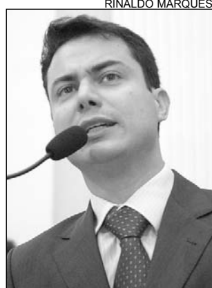
ALERTA - Clodoaldo

Passados 120 anos da Abolição da Escravatura, o racismo continua presente, apesar de os brasileiros não assumirem o preconceito. Ontem, o tema foi debatido pelo deputado Clodoaldo Magalhães (PTB). “É o racismo à brasileira, ninguém assume que é racista”, ponderou. O parlamentar defendeu as políticas afirmativas de inclusão social do Governo Federal, a exemplo do Bolsa-Família. “Não chamaria a iniciativa de compensatória e, sim, de indenizatória pelo débito histórico com seus beneficiários, predominantemente negros”, explicou.