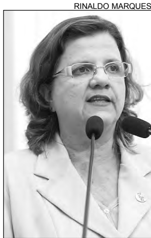
TERESA - Problema grave

“O assunto foi destaque nos principais jornais. Como presidente da Comissão de Educação e Cultura da Alepe, entrei em contato com a