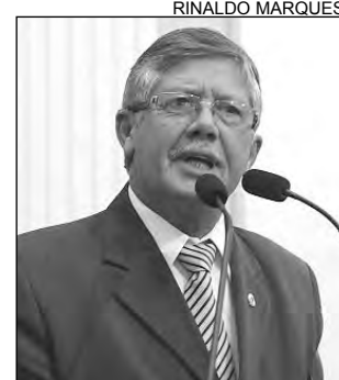
FERREIRA - Respostas

“A deputada informou que a iniciativa contou com a exposição de apenas 17 animais. No entanto, os dados