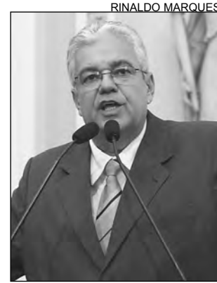
MORAES - Insatisfação

Após a revisão tarifária da Celpe, o parlamentar considerou indispensável um posicionamento da Compesa. “A empresa teve aumento superior ao da Celpe, no ano passado. Se a desculpa era a de