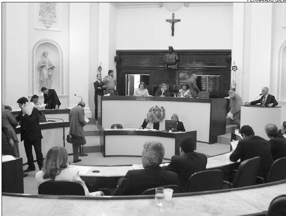
FUNCULTURA - Leite vai propor inclusão de legenda nos filmes nacionais

De acordo com o petista, a cada ano o festival se fortalece e se consagra, atraindo mais participantes. "É um estímulo à produção cinematográfica local", destacou. Durante o evento, Leite apresentará projeto de