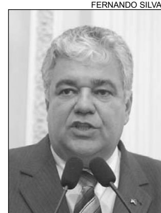
MORAES - Proposta

Atualmente, cerca de 90% das motocicletas que transitam no Estado, segundo Moraes, estão com o imposto atrasado. O deputado ressaltou que muitos proprietários não têm como pagar a dívida. Para implementar a medida, o Executivo precisa enviar projeto de lei ao Legislativo. "A legislação em vigor na Paraíba prevê o parcelamento dos débitos em até 60 meses, de acordo com o período de atraso. As parcelas não devem ser inferior a R$ 30,00 e o prazo para que a situação seja regularizada é de dois anos", acrescentou.