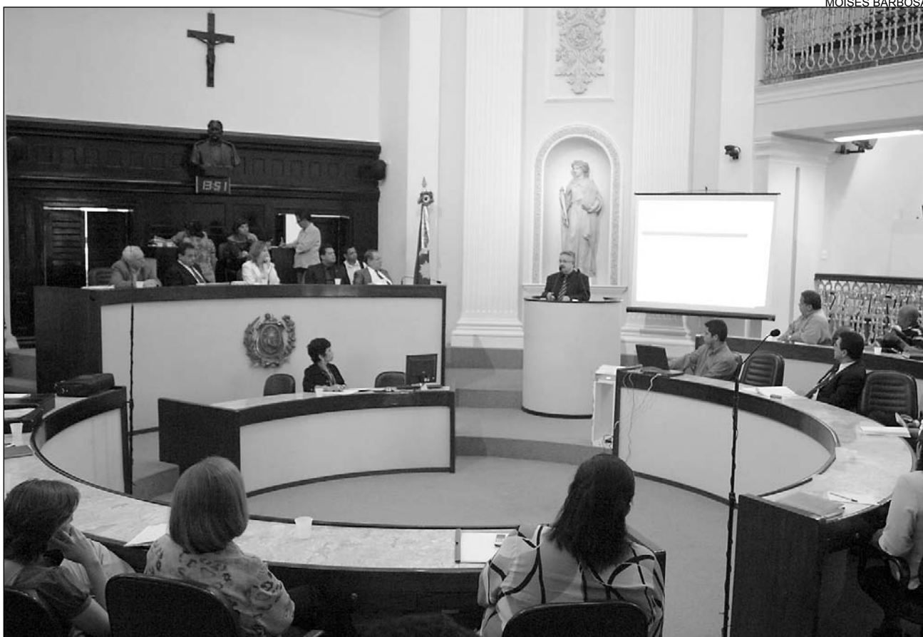
CRÍTICAS - Celpe e Aneel não compareceram à reunião. Iniciativa foi da Comissão de Defesa da Cidadania

Qualidade dos serviços oferecidos à sociedade também foi analisada