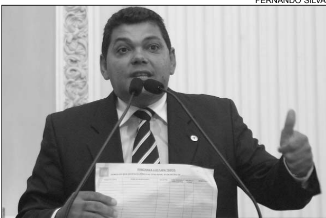
PREFEITURAS - Figueiró comemora parcerias