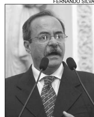
EURICO - Investigação

Eurico ressaltou as ações do prefeito com o objetivo de diminuir a violência na cidade. Há mais