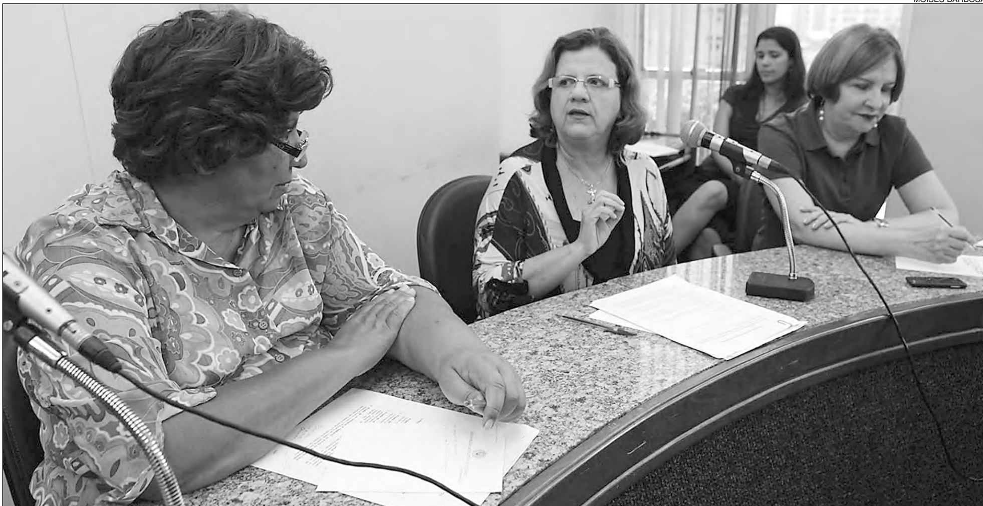
PRAZO - Lei que trata da implementação da medida data de 2005. No texto, foi estipulado o prazo de cinco anos, ou seja, 2010, para inclusão da disciplina na grade curricular